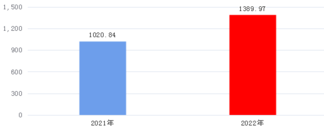
财政拨款收入、支出总计对比图（单位：万元）

2022年1月开始从其他单位调入我单位的工作人员有11人，且全部为正处级以上领导，导致工资津贴和和社保缴费大幅度增加。