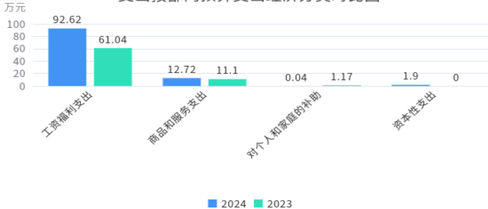
支出按部门预算支出经济分类对比图