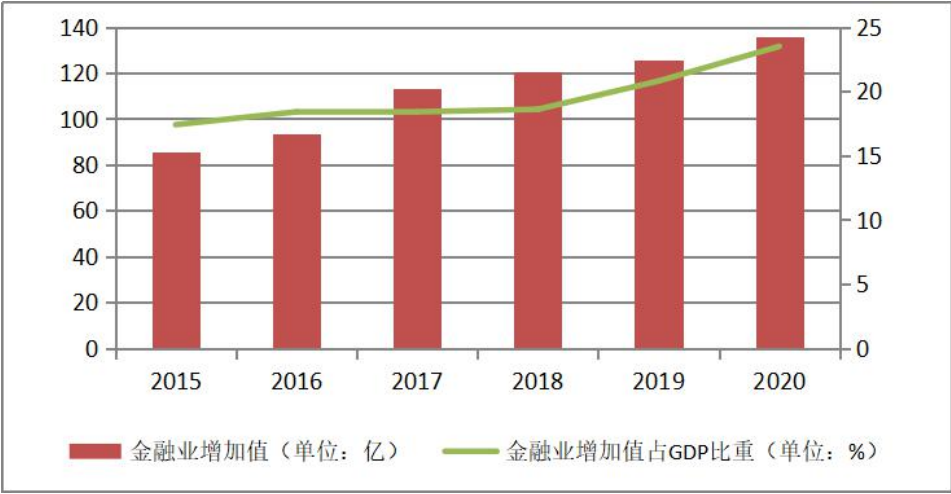
图 1 新城区金融业增加值及其占 GDP 比重情况

1. 金融机构总部经济薄弱。 由于区域发展规划和政策环境等因素制约，辖区金融机构总部和法人金融机构数量相对较少，原有的金融机构总部和法人金融机构出现外迁现象，但是新的金融