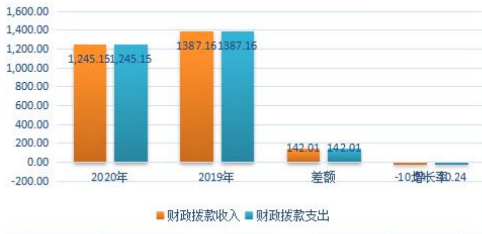
2019年-2020年收入支出差额比